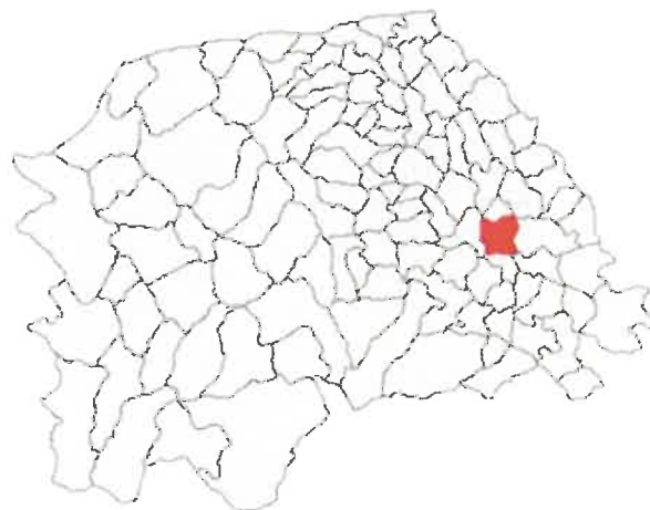
Amplasarea în cadrul județului