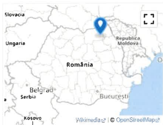
Bosanci (România) Poziția geografică în România

Drumul Județean DJ 208A– ce realizează legătura între Suceava catre Judetul Iasi.