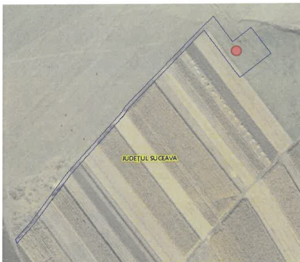
Fig. 1. Plan de amplasare în zonă

– distanța față de granițe pentru proiectele care cad sub incidența Convenției privind evaluarea impactului asupra mediului în context transfrontieră, adoptată la Espoo la 25 februarie 1991, ratificată prin Legea nr. 22/2001, cu completările ulterioare;