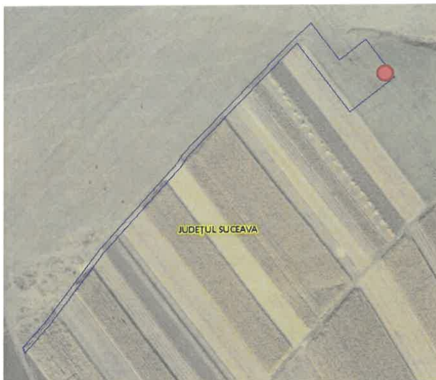
Fig. 1. Plan de amplasare în zonă

Imobilul constituie domeniul privat al Comunei Bosanci și se identifica prin parcela cu nr. cadastral 40653 ( S=5.500 mp), înscrisă în CF nr. 40653 a UAT Bosanci conform extrasului de CF pentru informare eliberat de OCPI Suceava.