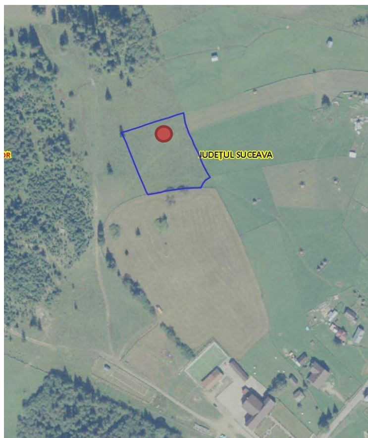
Fig. 1. Plan de amplasare în zonă

– distanța față de granițe pentru proiectele care cad sub incidența Convenției privind evaluarea impactului asupra mediului în context transfrontieră,