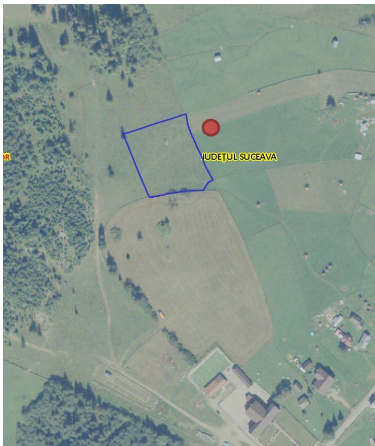
Fig. 1. Plan de amplasare în zonă

Imobilul constituie domeniul privat al Comunei Dorna Candrenilor și se identifica prin parcela cu nr. cadastral 40396 (S=4.831 mp), înscrisă în CF nr. 40396 a UAT Dorna Candrenilor conform extrasului de CF pentru informare eliberat de OCPI Suceava.