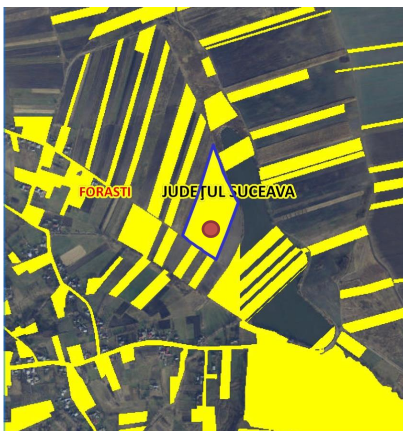
Fig. 1. Plan de amplasare în zonă

Imobilul constituie domeniul privat al Comunei Forăști și se identifică prin parcelă cu nr. cadastral 30540 (S=328.167 mp), înscrisă în CF nr. 30540 a UAT Forăști conform extrasului de CF pentru informare eliberat de OCPI Suceava.