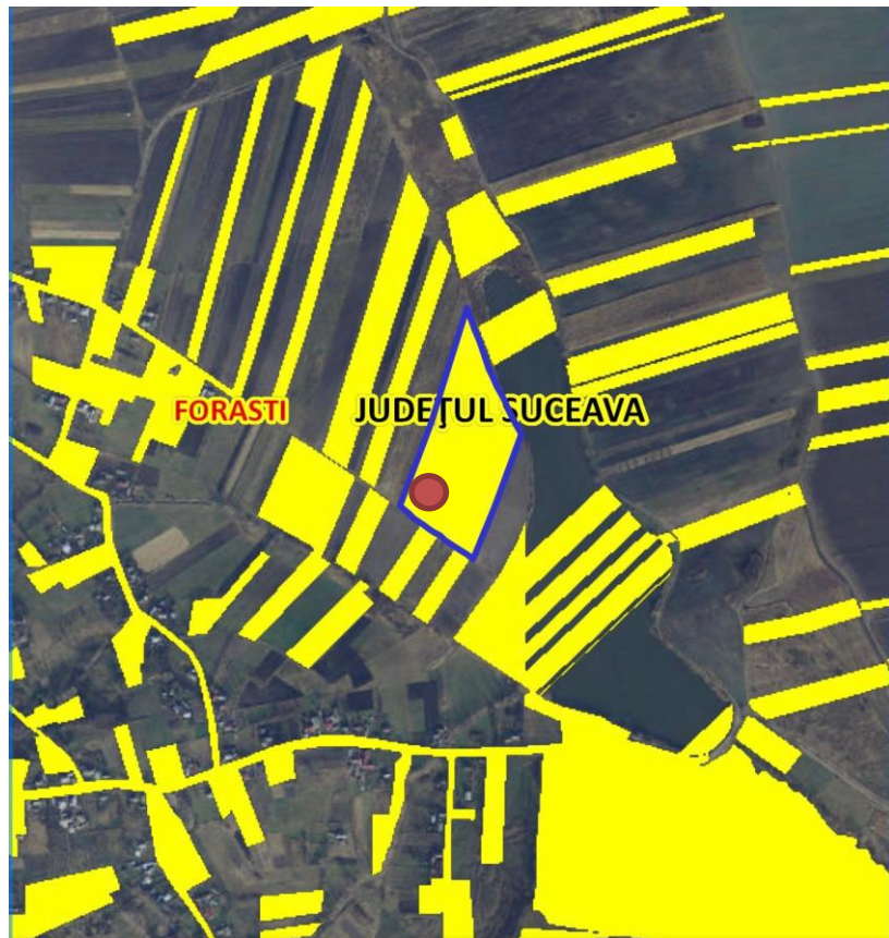
Fig. 1. Plan de amplasare în zonă

– distanța față de granițe pentru proiectele care cad sub incidența Convenției privind evaluarea impactului asupra mediului în context transfrontieră, adoptată la Espoo la 25 februarie 1991, ratificată prin Legea nr. 22/2001, cu completările ulterioare;