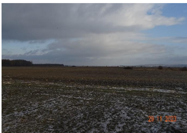
Fig nr. 6. Amplasament zona mal stâng r. Siret, în vecinătatea ROSAC0391

Toate suprafețele afectate temporar de execuția proiectului vor fi aduse la starea inițială la finalizarea lucrărilor, prin utilizarea de materiale native, care nu modifică structura și permeabilitatea locală, urmărind tendințele morfologice existente.