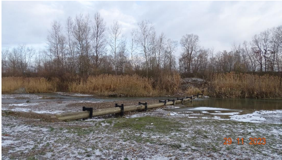
Fig. 1. Amplasament subtraversare existentă r. Siret