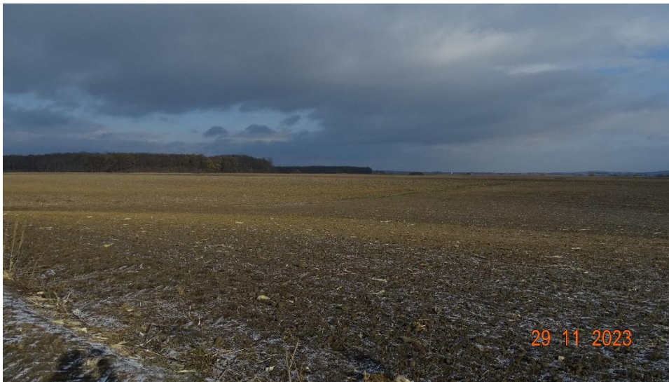
Fig. 2. Amplasament proiect zona mal stâng r. Siret (platformă iesire foraj și culoar de lucru întindere fir conductă)