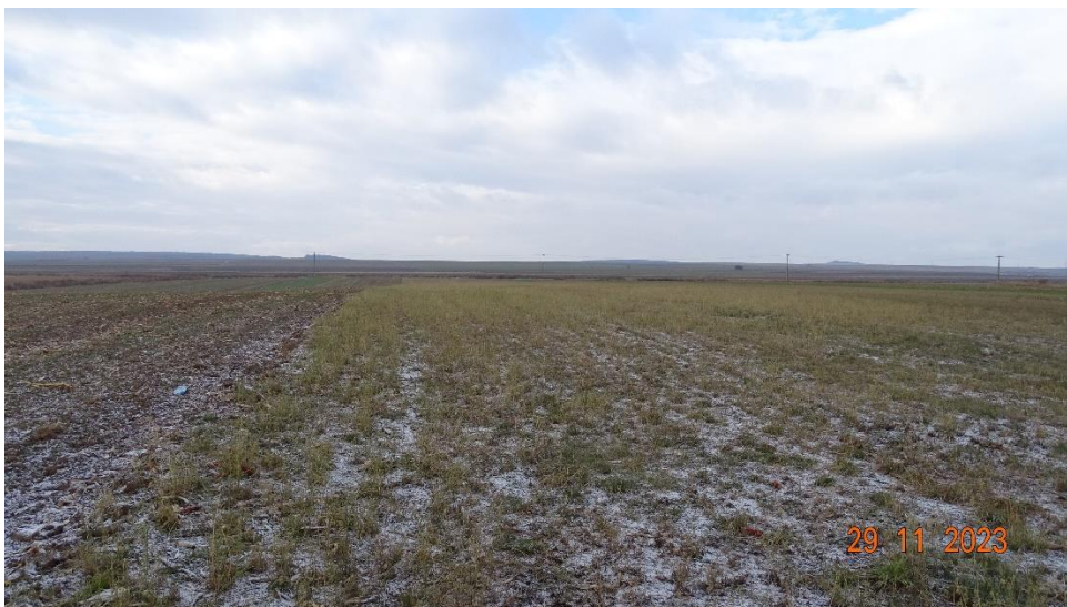
Fig. 3 Amplasament proiect zona mal drept r. Siret (platformă intrare foraj și drum acces temporar din DJ 208B)