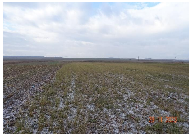
Fig nr. 7. Amplasament zona mal drept r. Siret, în vecinătatea ROSAC0391