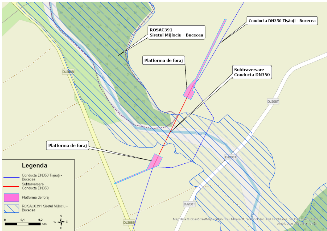
Fig. 5. Hartă privind localizarea proiectului în raport cu - ROSAC0391 Siretul Mijlociu – Bucecea

Descrierea intervențiilor desfășurate în vecinătatea ariei naturale protejate de interes comunitar potențial afectate, ROSAC0391 Siretul Mijlociu – Bucecea, este prezentată în tabelul de mai jos.