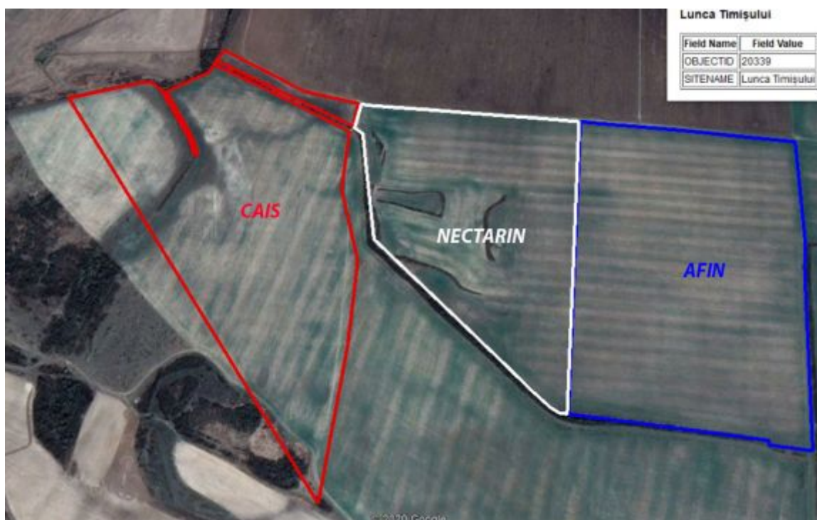
Situația în teren a vecinătăților parcelelor pe care sunt propuse plantațiile