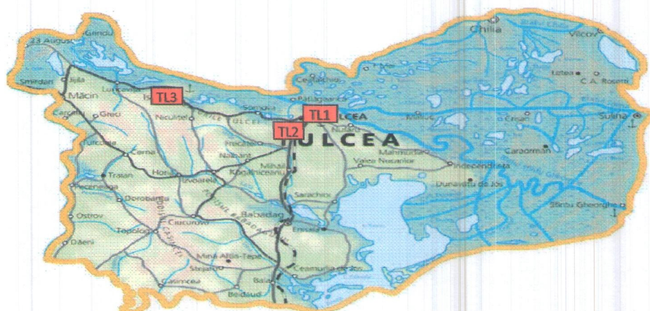
Amplasarea stațiilor de monitorizare în județul Tulcea

Prezentăm mai jos evoluția indicelui general de calitate a aerului din rețeaua locală de monitorizare a calității aerului