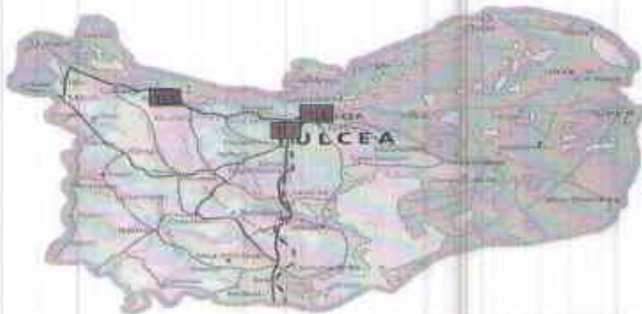
Amplasarea stațiilor de monitorizare în județul Tulcea

Prezentăm mai jos evoluția indicelui general de calitate a aerului din rețeaua locală de monitorizare a calității aerului