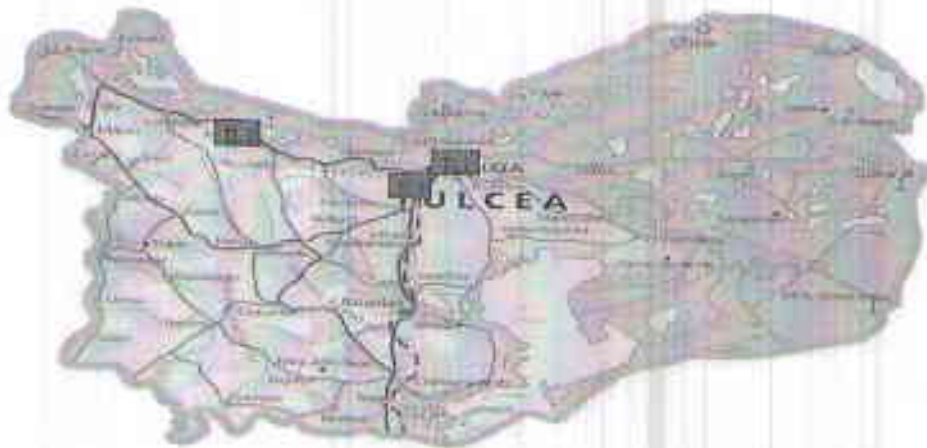
Amplasarea stațiilor de monitorizare în județul Tulcea

Prezentăm mai jos evoluția indicelui general de calitate a aerului din rețeaua locală de monitorizare a calității aerului