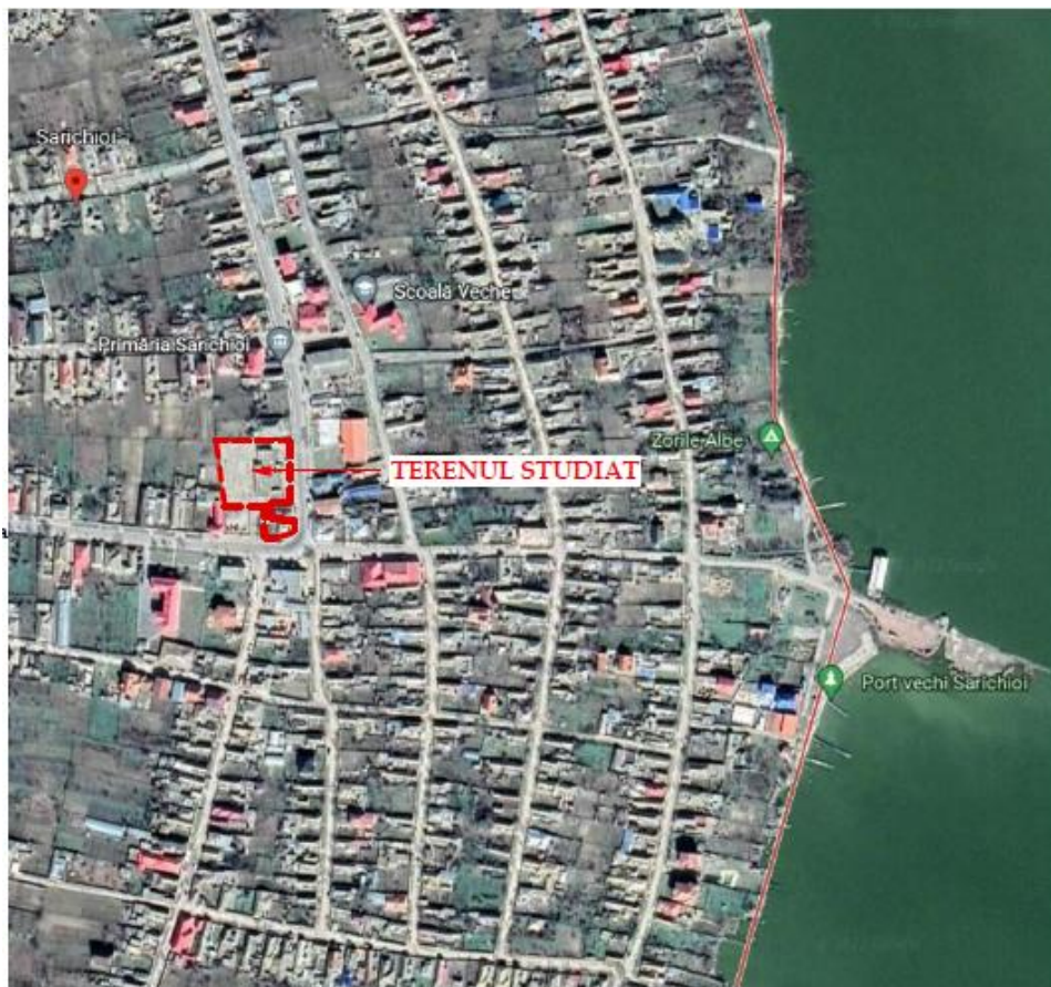
Fig. 1 – Plan de încadrare în zona