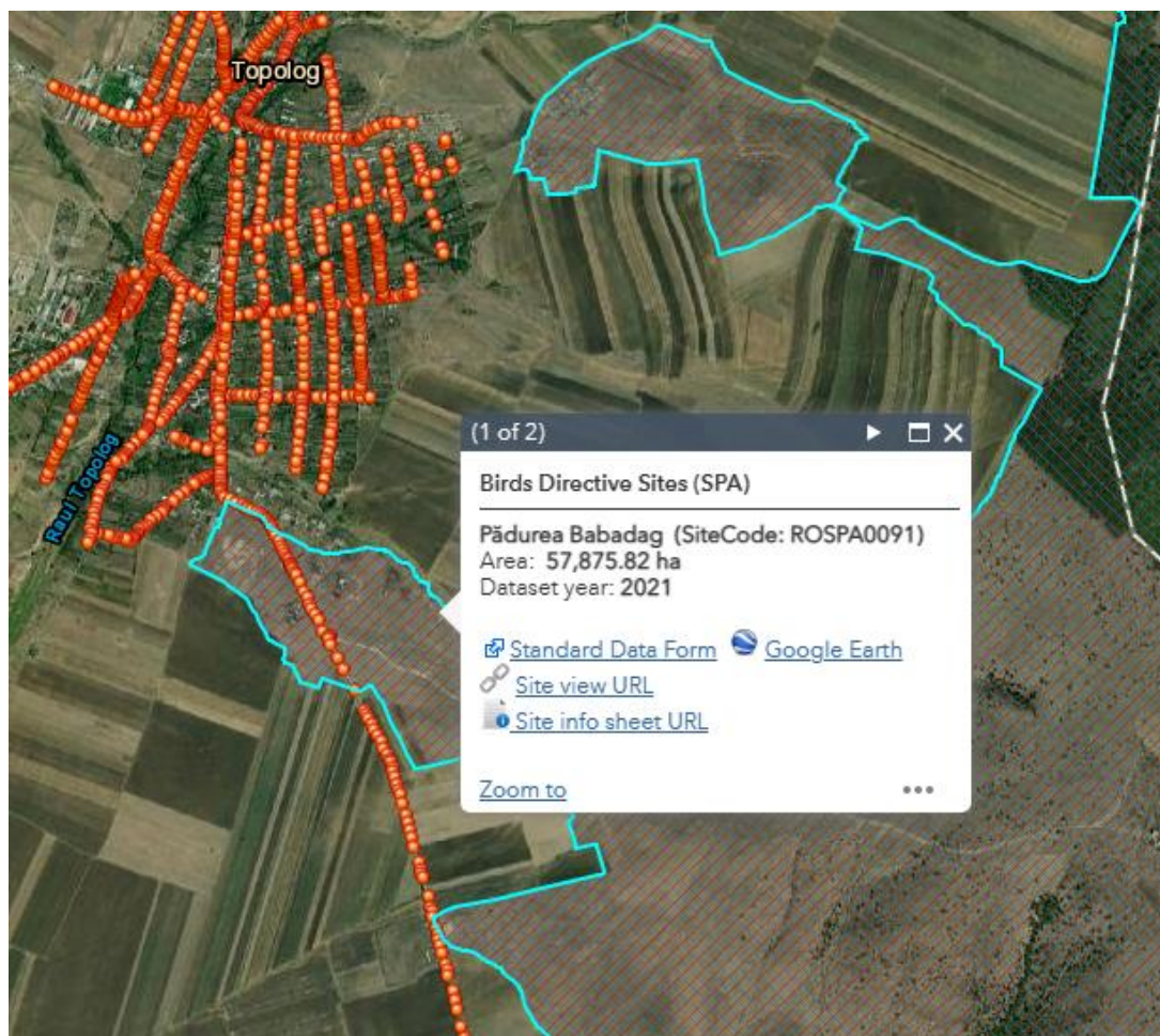
Harta suprapunere proiect cu siturile NATURA 2000 – localitatea Topolog