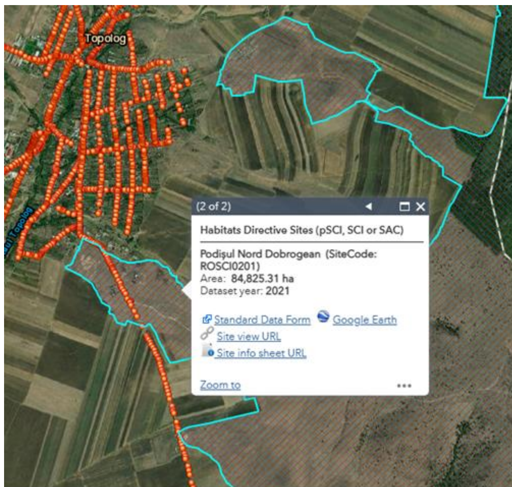
Harta suprapunere proiect cu siturile NATURA 2000 – localitatea Topolog

1. Situl de importanta comunitara ROSCI0201 Podisul Nord Dobrogean. În Podișul Nord Dobrogean habitatele naturale de interes comunitar sunt următoarele: