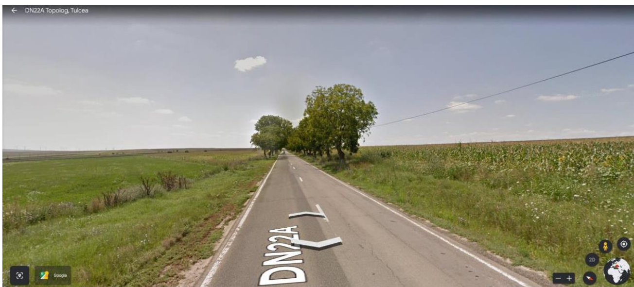
Imagini amplasament