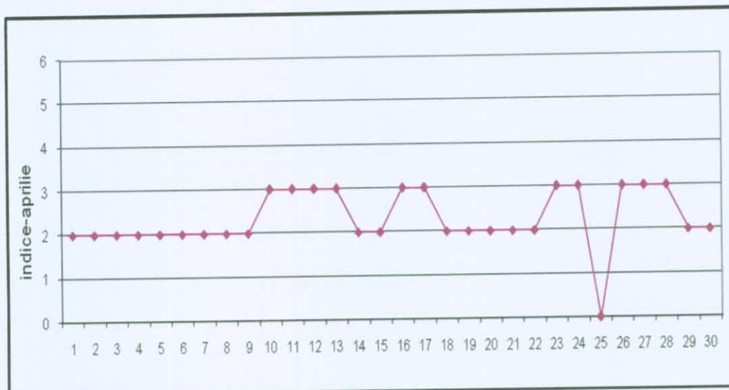
B. Variația concentrațiilor medii zilnice măsurate pentru indicatorii specifici.