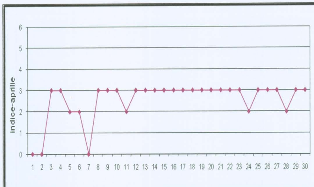
B. Variația concentrațiilor medii zilnice masurate pentru indicatorii specifici.