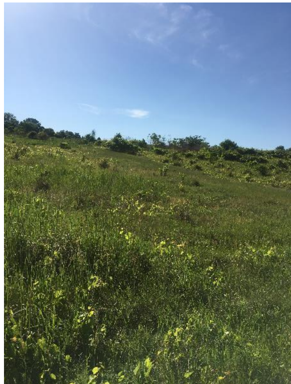
Imagini de pe amplasament: vedere spre nord- locuințe colective existente; vedere spre vest – panta relative mare a terenului și vegetație spontană