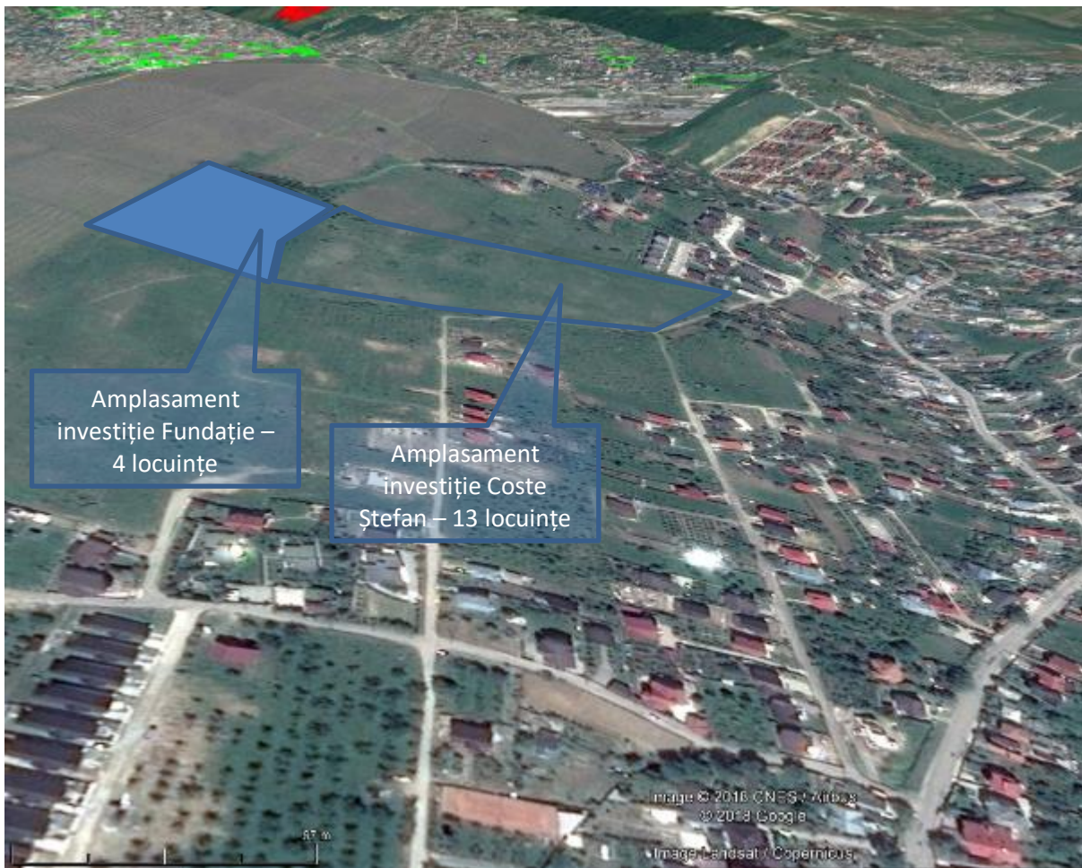
Amplasament în raport cu investiția vecină