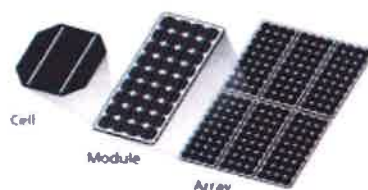
Figura nr. 2 Structura panoului solar

Pentru celulele solare, un strat subțire semiconductor este tratat special pentru a forma un câmp electric, pozitiv pe o parte și negativ pe cealaltă. Atunci când energia luminoasă ajunge la celula solară (fotovoltaică), în masa semiconductorului se produce o eliberare de electroni de pe nivelele atomice. Dacă se atasează conductori electrici pe părțile pozitive și negative, formând un circuit electric, electronii pot fi captati sub formă de curent electric - adică, energie electrică.