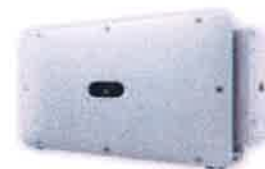
Figura nr. 5 Invertorul

Comparativ cu celelalte tipuri de celule, au un cost redus. La producerea lor, siliciul lichid se toarna in blocuri care apoi formeaza placi. In timpul solidificarii materialului, se formeaza structuri de marimi diferite la marginile carora apar defecte. Ca urmare a acestui defect al cristalelor, celula solara este mai putin eficienta.