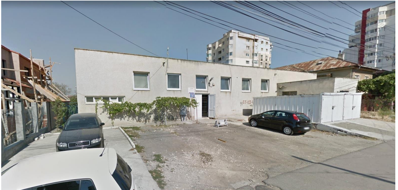
IMAGINI SIT DINSPRE STR. MUNCEL