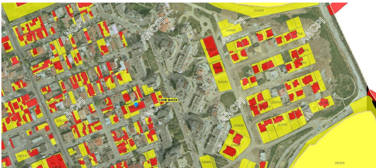
FIGURA 1-PLAN DE INCADRARE