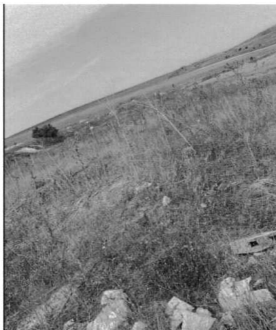
str. Dionisie cel Mic