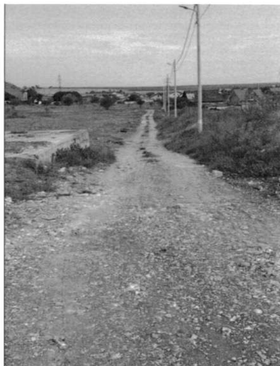
str. Constantin cel Mare