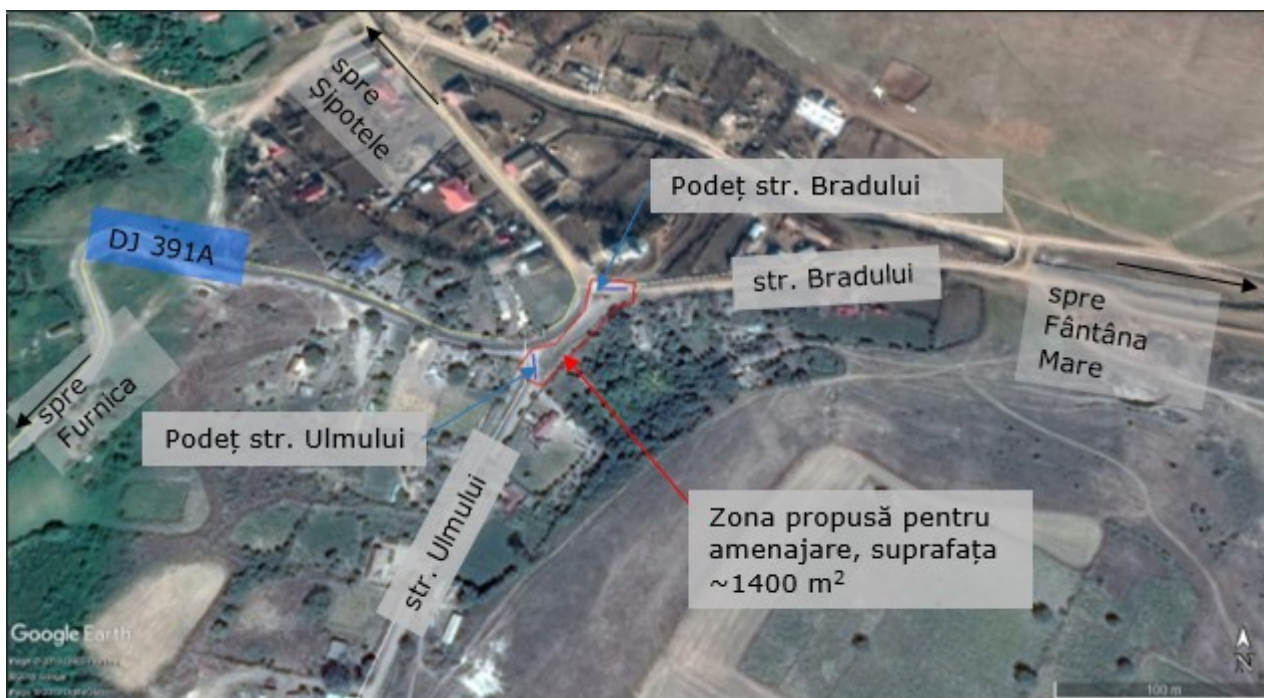
Fig. 1 Schiță cu amplasarea zonei propuse pentru amenajare, localitatea Tufani (Google Earth)

- coordonatele geometrice ale amplasamentului proiectului, care vor fi prezentate sub forma de vector in format digital cu referinta geografica, in sistem de proiectie nationala Stereo 1970.