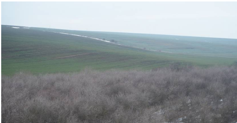
Aspect al terenurilor arabile de pe amplasament (WTG 3, WTG4, WTG 5) și a plantației de salcam din vecinătate (foto orig. 2023)