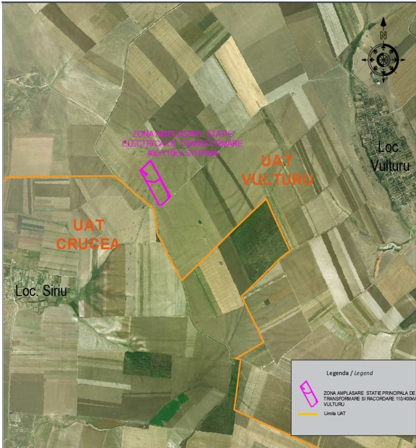
Fig. 2 Detaliu amplasament proiect Statie electrice de transformare si racordare 110/400kV Vultur