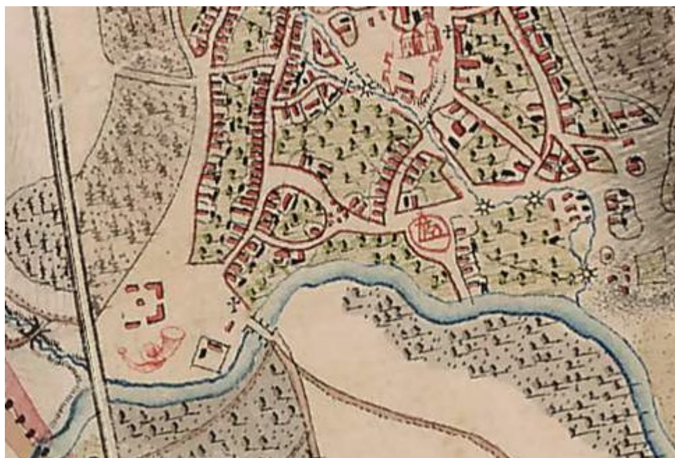
Extras din Josephinische Landesaufnahme of the Habsburg Empire 1769 - 1773

În conformitate cu studiul istoric 1 evoluția zonei surprinsă prin suprapunerea hărților istorice începând cu secolul XVIII, evidențiază faptul că malul nordic al râului Arieș, pe zona studiată a fost liberă de construcții și și-a păstrat de-a lungul timpului caracterul de zonă verde (luncă), în ultimul secol fiind amenajat un parc urban în această fâșie.