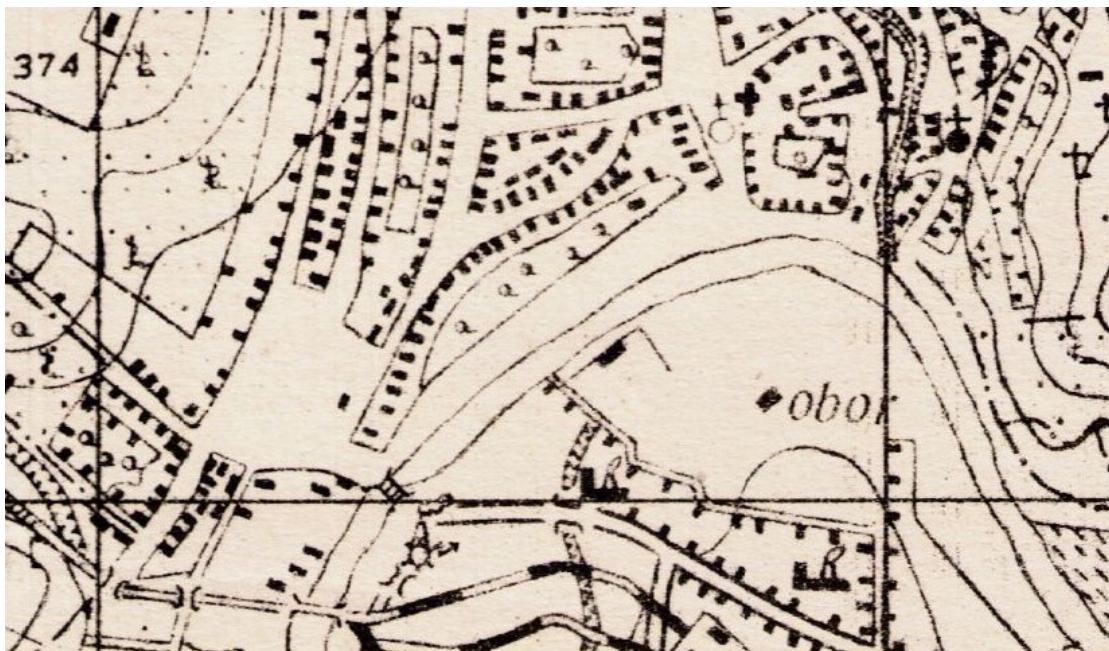
Extras din Lambert-Choleski system, Planurile Directoare de Tragere, Directia Topografică Militară, retipărit în 1955, executată la FMC în anul 1952 folosindu-se ca material de bază ridicarea din anul 1890, actualizat reambularea din anul 1938, planșa 3067 TURDA, scara 1:20000

În conformitate cu FIȘĂ DE REGLEMENTARE A ZONEI ISTORICE "ANSAMBLU URBAN DE SECOL XVIII-XIX" MUNICIPIUL TURDA 2 spațiile publice ale piețelor și străzilor din cadrul ansamblului se pot amenaja alei pietonale, cu finisaje nobile și stratigrafia normată, prevăzute cu pante de scurgere și rigole deschise prevăzute cu grătar. spațiile verzi vor fi prevăzute cu gazon iar studiu dendrologic va evita obturarea fațadelor cu valoare istorică.